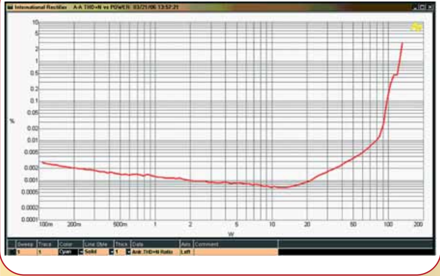
Bild 1. IC-Gatetreiber tragen zur Vereinfachung der Entwicklung von Class-D Verstärkern bei und bieten eine den besten Class-AB Verstärkern ebenbürtige THD+N-Performance

Die Unterspannungssperre (Under-Voltage-Lock-Out) stellt ein weiteres wichtiges Schutzmerkmal dar. Wenn die Stromversorgung unter die minimale Betriebsspannung