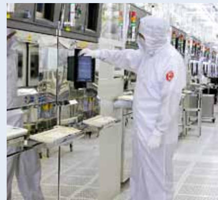
An individual wafer runs through the clean room in around one thousand steps, for which stable processes are absolutely necessary.

Innovation teams develop new fields of applications on the basis of our present integration schemes, individual processes and process blocks. However, innovation is not just restricted to technology – we also promote innovation in automation and pioneering manufacturing concepts, business processes and methods, as well as maintenance schemes and equipment engineering.